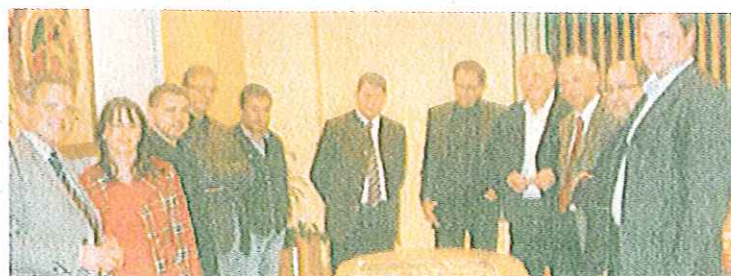
Das Planungsteam zur L601Neu nahm bereits die Arbeit auf. Die erste Arbeitssitzung verlief sehr konstruktiv.

Alle an der L601-Thematik Interessierten können sich auf der Homepage: www.l601neu.at nähere Informationen besorgen, sich den Newsletter bestellen und sich engagieren. •